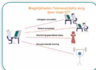
Telerevalidatie zorg door inzet ICT

heeft de projectaanvraag "Centre for Long term Care Technology Research, CCTR" ondersteund. IZO verwacht dat de uitkomst van het onderzoek naar nieuwe instrumenten in de gezondheidszorg, extramurale veilige technologie in hoge mate bijdraagt aan het ontwikkelen van nieuwe zorgdiensten.