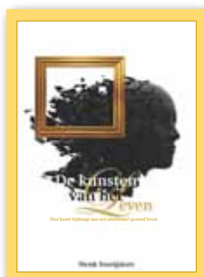
De kunsten van het leven © Henk Smeijsters, uitgever Veen Magazines