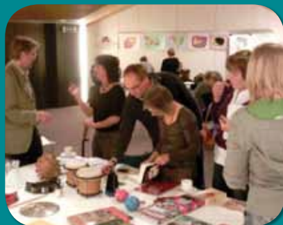
De kunsten van het leven