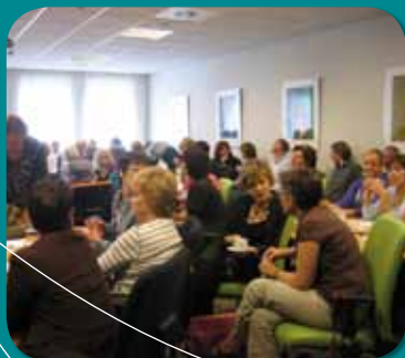
Je ziet pas als je het gelooft

In de vergaderingen van de werkgroep gedragsproblematiek bij Ouderen is uitvoerig gesproken over vroegsignalering door systematische observatie. De werkgroep brengt vervolgens aan de IZO Twente leden een advies "vroegsignalering bij GGZ problematiek" uit. Dit advies wordt door de bestuurders goed ontvangen. In het kader van het Vilansproject 'ban de band' wordt gesproken over (non)fixatiebeleid en attitudeverandering. De praktische deelnemerservaringen worden verwerkt in een artikel dat via Last*Post, het communicatiemiddel van de werkgroep gedragsproblematiek bij Ouderen, onder de medewerkers van de IZO leden wordt verspreid. In de vergaderingen was natuurlijk ook aandacht voor de voorbereiding en evaluatie van de twee werkconferenties "Je ziet het pas als je het gelooft" (ouderenmishandeling) en "de kunsten van het leven" (inzet van creatieve therapievormen).